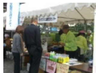
販わうシュハスコ売り場

コーラス、アートフラワー、陶芸、語学、パン作り等多岐にわたっており、それぞれ趣向を凝らした発表や展示、即売会等を行い、来場者を楽しませました。当センターも積極的に参画し、当会館前広場でブラジルのシュハスコ、飲茶セット、焼きそば等を実演・販売し、できたての料理を楽しんでいただくとともに、英会話体験等をしていただく等、多くの方々と交流をはかりました。