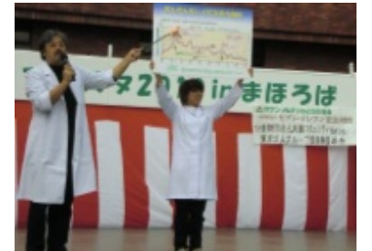
大和川がきれいになりつつある 原因について皆で考えました

ドイツからの招聘、及びイベントは、セブンイレブンみどりの基金・一般財団法人セブン-イレブン記念財団様及び公益財団法人大阪コミュニティ財団/東洋ゴムグループ環境保護基金様から助成をいただきました。