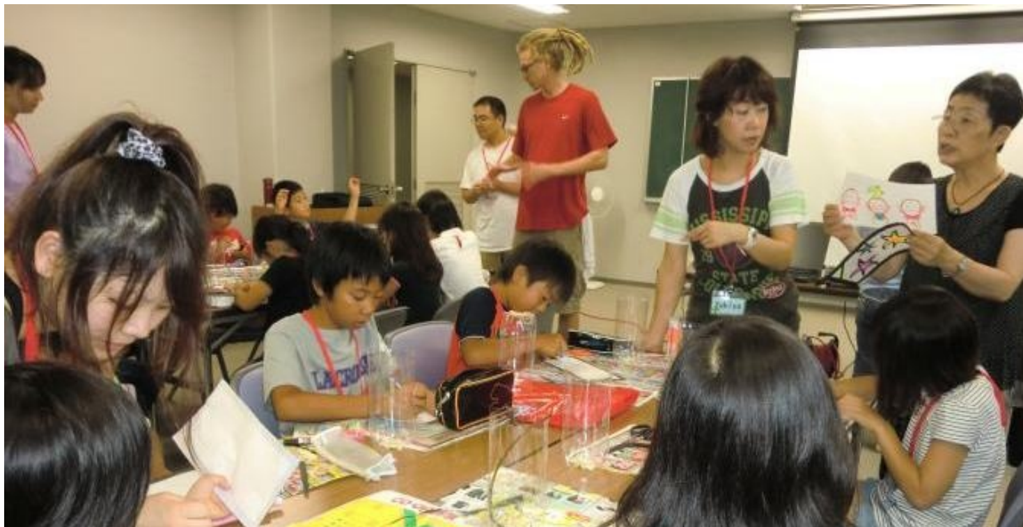
奈良ストップ温暖化の会から講師をお招きし、ペットボトルでソーラー・ランタンを作りました。(8月6日エコ・キャンプで)