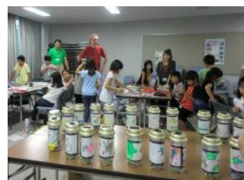
ソーラー・ランタンが完成!