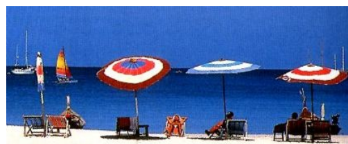
美しい海と白砂を持つプーケット