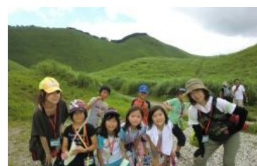
フォトテリングに出発!