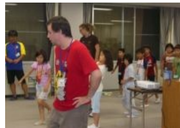
カウボーイダンスを練習中

翌日は、6時に起床。高原のすがすがしい空気をいっぱい吸って元気よくラジオ体操をしました。朝食後は、フォトテリング。グループ毎地図を片手に大自然を体感しながら、いろいろな指令やクイズに答えていきました。フォトグラファー(写真家)になった気分グループ毎、たくさん写真もとりました。午後は、ソーラー・ランタン作りに挑戦。奈良ストップ温暖化の会から講師を招き、節電にまつわるお話を聞いた後、ペットボトルをリサイクルし、太陽電池を取り付けるソーラー・ランタンを見事に作り上げました。部屋を暗くしてランタンを灯したときには、「わぁーっ」と歓声があがりました。