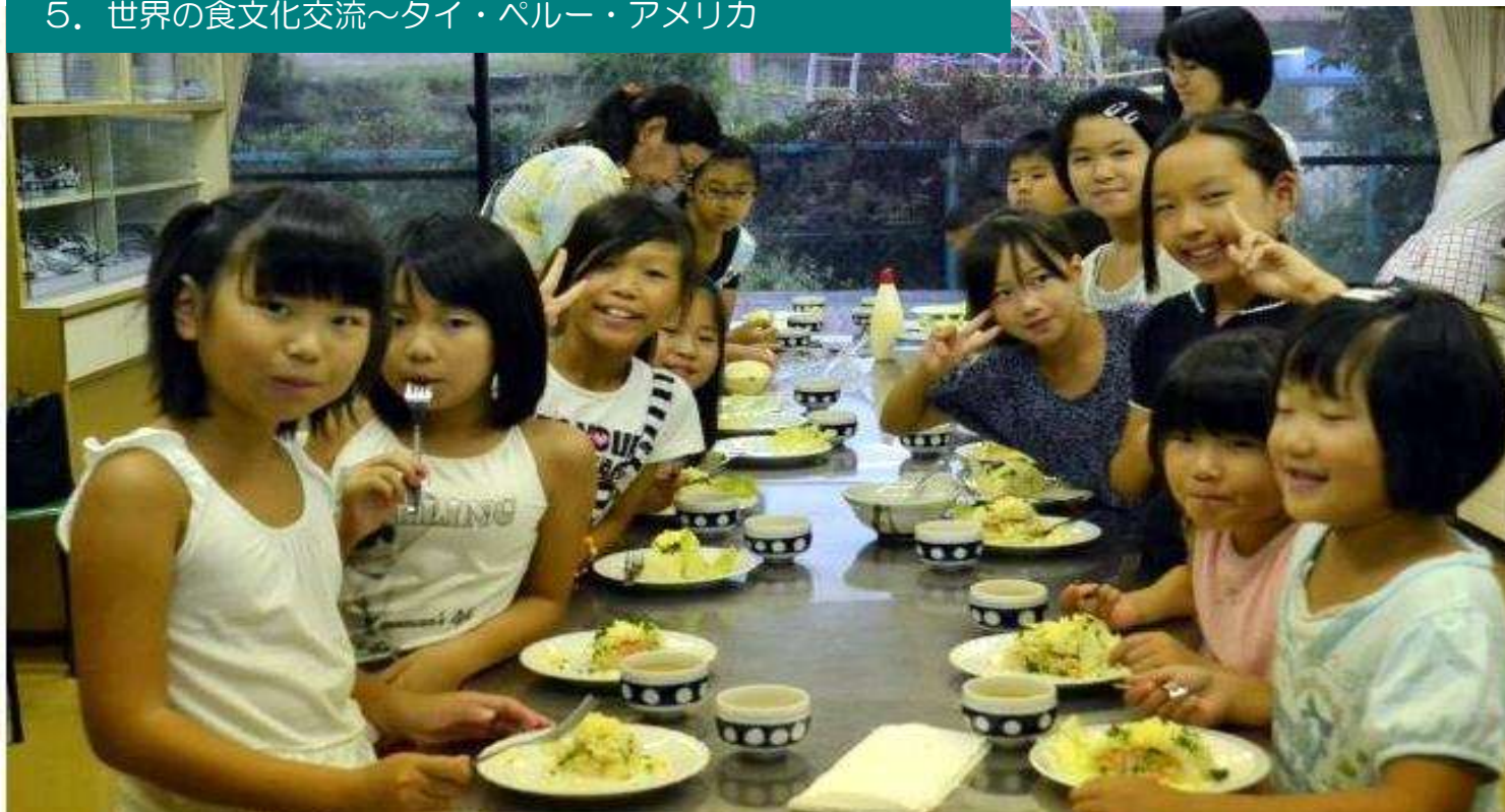
新しい公共モデル事業「世界の食文化交流」でペルーのデザート「ジャガイモケーキ」を作りました（橿原市真菅地区公民館にて）