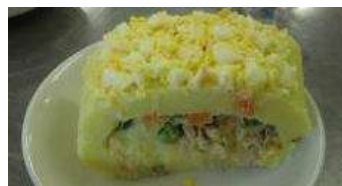
ジャガイモケーキが完成！