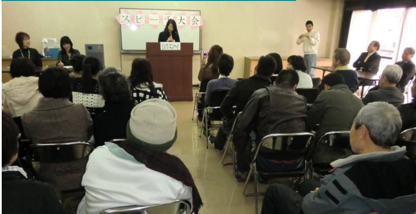
「日本語教室」の生徒さんによるスピーチ大会が行われました（橿原市中央公民館にて）