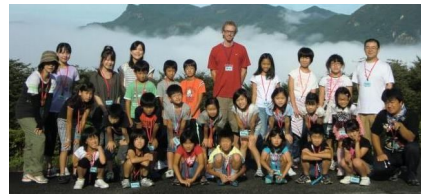
昨年のエコ・キャンプから

実施日： 8/3(金)～4日(土) 8/14日(火)～15(水) 対象：小学3～6年生 参加費：15,000円(1人) お問い合わせ・申し込み：榎原事務所(0744-23-9908) キャンプのお手伝い頂けるボランティアさんも募集中！