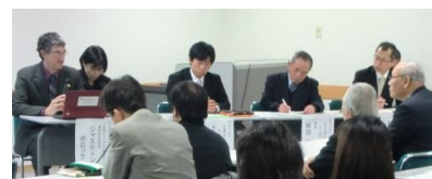
パネリストのみなさん