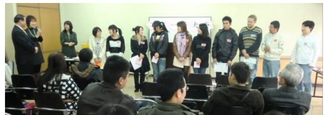
スピーチされたみなさん