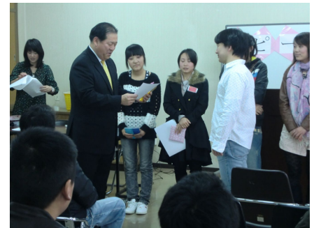
表彰状を受け取る入賞者