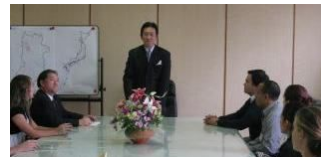
森下豊檀原市長と懇談