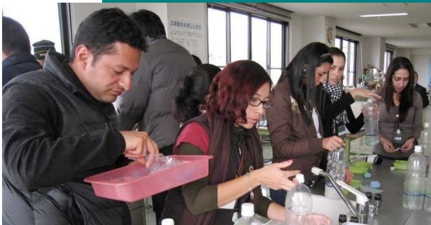
中南米12カ国の環境担当公務員20名が奈良県で環境対策について勉強されました。(橿原市リサイクルセンターにて)